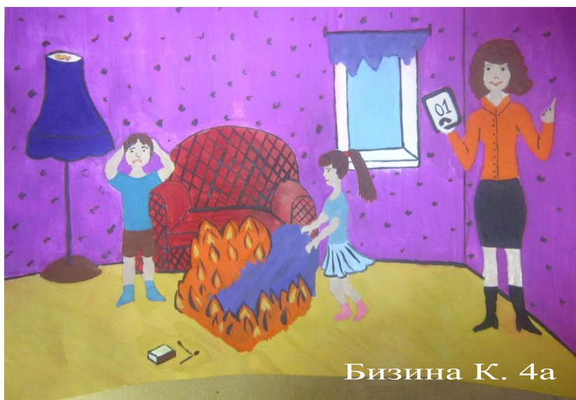
Бизина К. 4а