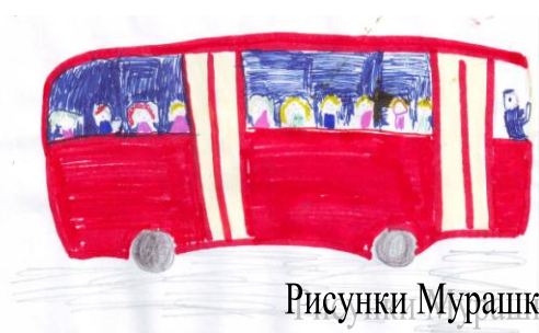
Рисунки Мурашко Д. 2б класс